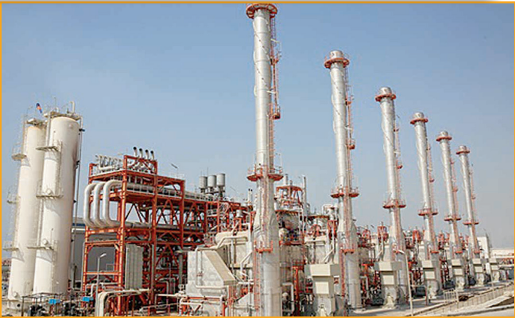
سرپرست راهاندازی بخش خشکی طرح توسعه فاز ۱۳ پارس جنوبی از آغاز تولید و ذخیره‌سازی میعانات گازی در پالایشگاه این طرح خبر داد.